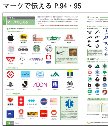
マークで伝える P.94・95